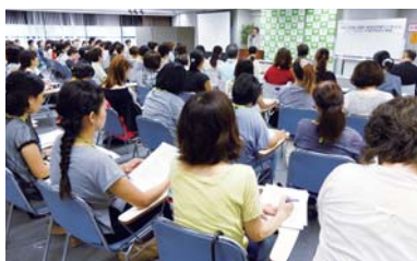
若者の貧困や奨学金問題について考える学習会なども各地域で開催しています