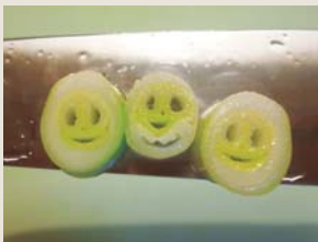
東京都大田区 むーむー 30代

CO・OPの軟白ねぎは、夏でも柔らかくてとてもおいしいです。先日そのねぎを切っていたら“ねぎ三兄弟”が！