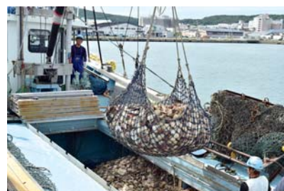
ほたての水揚げの様子