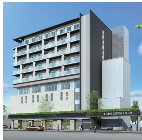
コブみらいえ中野は東京都生協連会館の6～9階