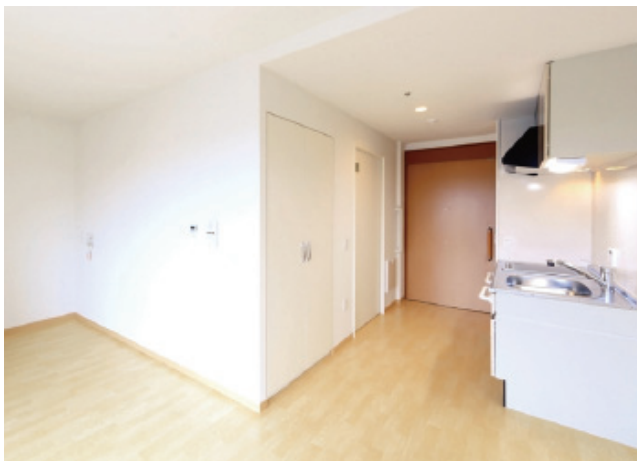
居室例:8階Bタイプ(イメージ)