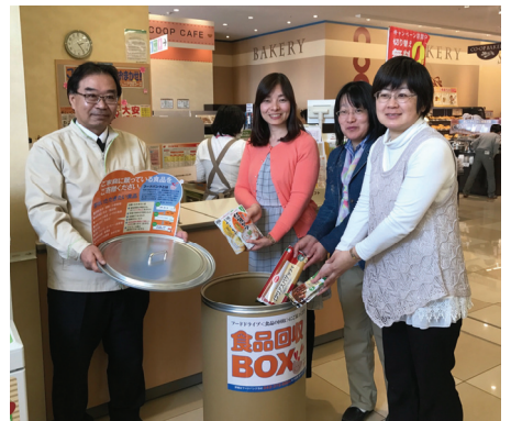
コープ東寺山店に設置したフードバンク専用の回収ボックス

「フードバンク」は、品質に問題がないのに廃棄せざるをえない食品を、企業・団体・個人から寄付してもらい、必要としている方に食品を無償で届けるボランティア活動です。中でも、個人の方にご協力いただき、ご家庭で余っている食品を持ち寄っていただく取り組みは「フードドライブ」と呼ばれています。今回、千葉県内の小売り店舗としてコープみらいが初めて、店内に専用の回収ボックスを常設し、組合員や地域にお住まいの方に「フードドライブ」を広く呼びかけます。