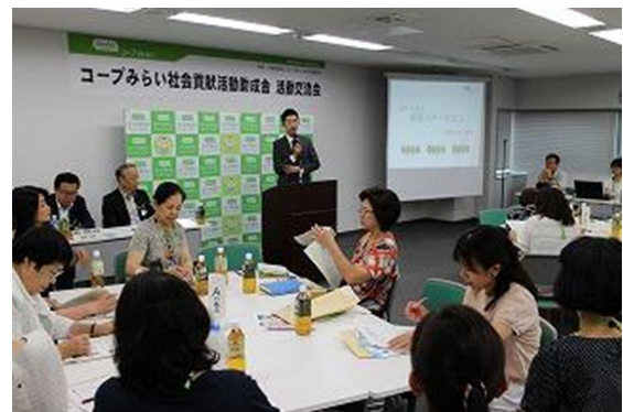
昨年の活動交流会の様子

『2018年度コープみらい(千葉エリア) 社会貢献活動助成金 活動交流会』では、「2016年度コープみらい地域かがやき賞」受賞5団体と「2017年度コープみらい地域かがやき賞」受賞3団体、また、「2016年度コープみらいくらしと地域づくり助成」助成19団体と「2017年度コープみらいくらしと地域づくり助成」助成17団体の中から、23団体・51人にご参加いただき、代表して3団体に活動内容と成果を報告していただきます。そのほか、参加各団体と組合員との連携や団体同士の協同について話し合い、“安心してらせる社会づくり”を目指して交流を深めていただきます。