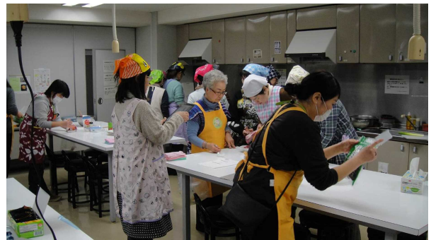
家庭でストックしている食品を持ち寄ってメニューを考え、調理して食べる「サルベージパーティ」の実習(昨年のような)

※ご取材を希望される方は、下記の連絡先までご連絡くださいますようお願い致します。