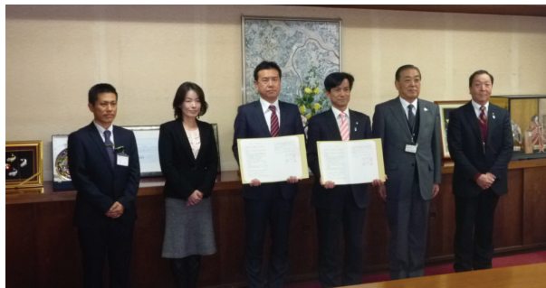
▲八千代市との協定締結式(2014年12月17日)

コープみらいの行っている店舗やコープデリ宅配等の業務の中で、異変を発見し、市町村や地域包括支援センター等に通報する件数は、急激に増えています。千葉県においては、2013年度の4件から2014年度には16件と4倍に増えました。今年度も2014年度を大きく上回るペースで、8月までに13件に上っています。通報事例の中には、旅行に行かれていたというケースや、時には残念ながら亡くなっていたというケースもありますが、救急車の出動で病院に搬送でき、元気になられたというケースもあります。