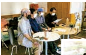
◀深夜ラジオ感覚で聞いただけで参加できる「ヒルトーク」

くらしや文化の向上、社会発展、地域の活性化をめざして、「コープみらい・くらしと地域づくり助成」で助成を受けた市民団体の活動を紹介します。