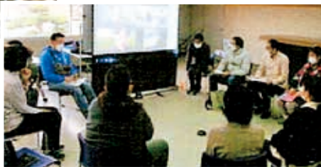
引きこもり当事者、家族などの懇談会▶