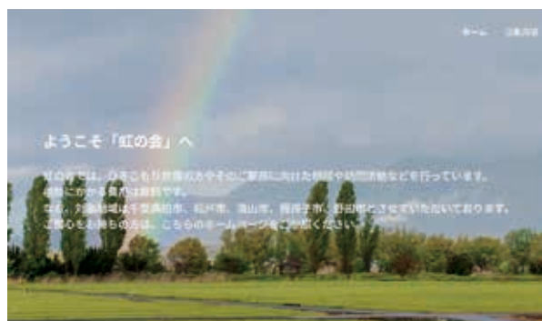
虹の会のホームページより

地域の活性化、地域・生活文化の向上、環境保全をめざして取り組み、 「コープみらい・くらしと地域づくり助成」で助成を受けた市民団体の活動を紹介しています。