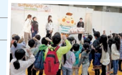
ほべたん じゃんけん大会