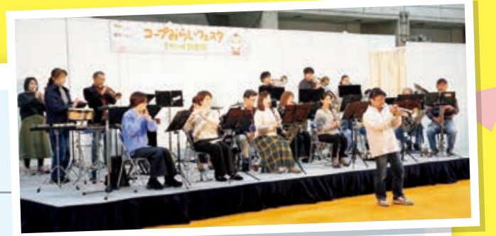
コープみらい地域クラブ i-Brass