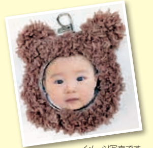
イメージ写真です

締め切り 2月13日(金) 17時まで 応募多数の場合は抽選 結果は2月16日(月)までに全員にメールで連絡