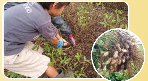
受粉した花が枯れた後に、子房へいが地面にのびてその先の地中に実がなり、その後収穫します