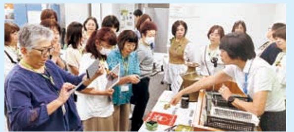
ユニセフ教室の様子

問い合わせ 千葉県ユニセフ協会 TEL 043-226-3171 10時~16時(土・日・祝日休み)