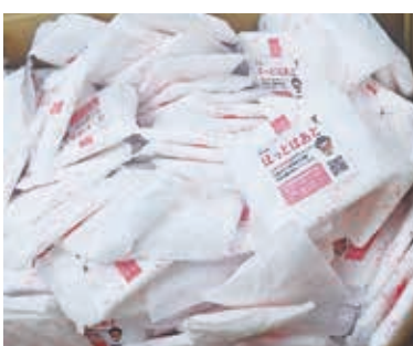
生理用品にシールを貼り、トイレに設置しています

地域の活性化、地域・生活文化の向上、環境保全をめざして取り組み、「コープみらい・くらしと地域づくり助成」で助成を受けた市民団体の活動を紹介します。