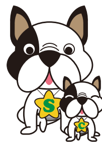
サポっち & ちぼっち

正しい情報の見分け方について一般の消費者に向け、わかりやすくお話しさせていただきます。