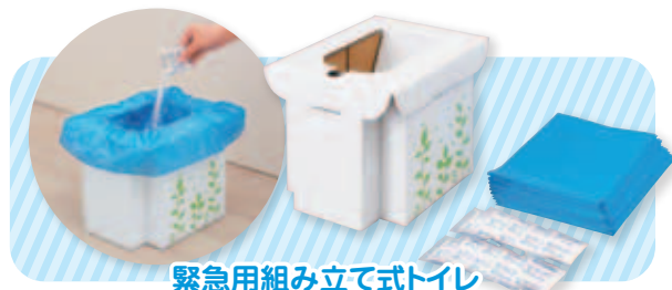
緊急用組み立て式トイレ