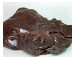
焼けた銅貨