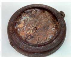
焼け跡からの懐中時計

午前1時39分から3時5分にかけて、129機のB29による攻撃で、「七夕空襲」とも呼ばれています。目標は千葉市街地で火の海と化しました。中心市街地の大部分が焼き尽くされ、死傷者1,204人、被災戸数8,489戸、被災面積205ヘクタールにおよびました。