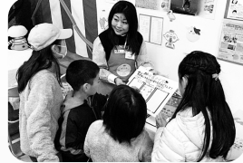
四街道消費生活展