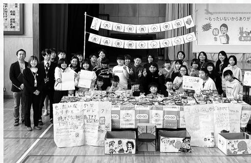
セレモニーの様子

コープみらいと千葉2区ブロック委員会は、これからもこの活動を見守り、応援していきます。