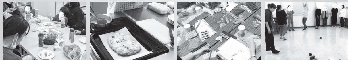
▲ロールケーキ試食