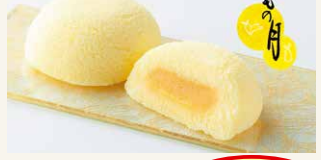
人気のお菓子詰め放題