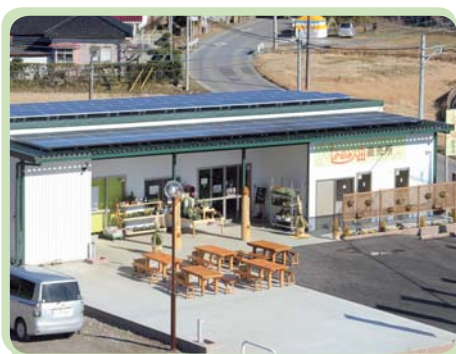
直売所「しんのみ畑」の屋根に設置された太陽光発電パネルで発電された電気が届けられます

コープの産直産地として30年以上つながりのある多古町旬の味産直センター（千葉県香取郡多古町）。農産物の生産だけでなく、田植えや稲刈りなど組合員との交流も積極的に進めています。直売所の屋根に太陽光発電パネルを設置し、2017年12月から、農産物だけでなく電気も「コープデリでんき」として組合員に届けられるようになりました。