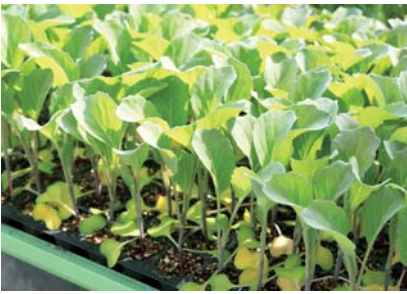
1カ月過ぎたところ。畑に植えられる10~15cmの苗に育ちました

して何より、キャベツを一番の適期に収穫できるように、種まきから考えているといいます。「良いキャベツを育てるには、いかに病気がなく大きさがそろった苗に育てるかが勝負です。苗や土の状態を見て、日によってあげる水の量を変え、葉が巻かない可能性のある苗は、この時点で取り除きます」育苗ハウスでは、エリアごとに成長度合いの違った小さな苗が元気に育っていました。最初の段階でのきめ細かな作業が、立派に育つキャベツの数を安定させているのです。