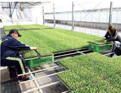
夫婦で向かい合った作業

定植後は、虫や病気を防除するために必要なときだけ消毒や除草を続けながら、4カ月間畑に苗を植え続けます。「1年で一番忙しいのは、収穫と苗の植え付けが重なる時期。午前1時半には収穫を始め10時頃まで収穫、気温が上がる時間に休憩を取り、夕方5時頃まで仕事をします」