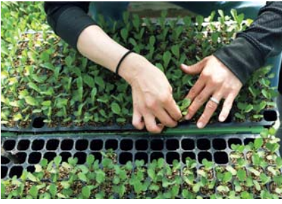
成長過程を見ながら、質の悪い苗は取り除いていく地道な作業です

「2月中旬、育苗ハウスでの種まきから1年の仕事が始まります。1週間くらいで芽が出て、1カ月ほどで畑に植えられる大きさに育ちます。