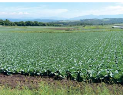
広大な畑に見渡す限りのキャベツです

「育苗ハウスや自分が使う機械をいつもきれいに保つよう心掛けています。それが良い畑の状態や、良質なキャベツの生産につながると思っています。今後とも安定的に供給していきたいです。」 キャベツは新鮮なうちに食べるのが一番おいしいと思います。葉っぱを切ったところから鮮度が落ちるので、できれば、一度に丸ごと楽しんで食べていただけたらうれしいです」 野菜炒めに浅漬けに、とんかつなどの付け合せ、サラダ、ロールキャベツ、スープ、キャベツは食べ方もいろいろ、使い勝手のいい野菜です。今年の夏は、丸ごとキャベツをたっぷりめしあがってはいかがでしょうか。