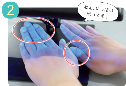
専用のライトを当てて確認。洗い残しの部分が白く光ります。特に爪の周り、関節のしわの部分が多く光っていました。