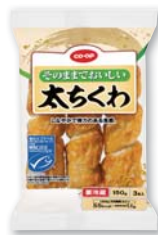
CO-OP そのままおいしい太ちくわ