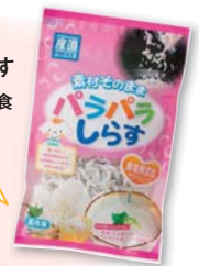
※宅配のみ取り扱っています