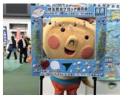
▲大きなインスタフレームでの記念撮影も大好評!