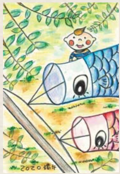
埼玉県比企郡 夏野海

テーマトーク、身の周りの話題やくらしの知恵、お気に入りのコープの商品、簡単レシピ、誌面の感想、7月号掲載用のイラスト、写真など、皆さんの楽しいお便りをどしどしお寄せください！