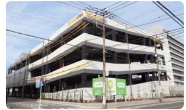
コープデリ東糀谷センター外観

コープみらいと糀谷地区自治会連合会は、2018年7月に防災対策に関する協定を締結しました。コープデリ東糀谷センターは、備蓄庫を設置して非常用飲料水を保管、非常時に配布するほか、津波や高潮の発生等の災害時にはセンターを避難塔として地域住民に開放するなど、地域の防災拠点としての役割を積極的に担います。