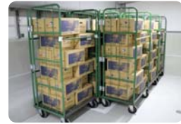
備蓄庫に保管している飲料水