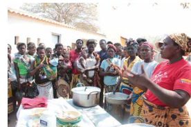
ボランティアによる栄養指導の様子。カロリーや栄養価の高い離乳食作りを母親たちに広めるため、住民から保健員やボランティアとなる人材を育成しました

5歳の誕生日を迎えられない子どもたちがいます。世界で5歳の誕生日を迎えない子どもたちは、年間およそ530万人。その半数以上300万人がアフリカの子どもたちです。その死因の多くは肺炎、下痢など。日本では予防や治療ができる病気で命を失ってしまうのは、多くの子どもが「栄養不良」で、体力がなく免疫力が弱いからです。栄養不良の原因は、食料が十分に得られないだけではありません。栄養や育児に関する知識が不足しているため、偏った食料しか使わなかったり、「赤ちゃんに母乳ではなく水を与える」といった古い慣習が根強く残っていたりするため、成長に必要な栄養素が足りず、多くの子どもたちが栄養不良に陥っているのです。 牛乳を飲むことが、子どもたちへの支援につながります。こうした状況の改善を願い、コープデリグループでは2008年度に「ハッピーミルクプロジェクト」を開始しました。牛乳の売り上げの一部をユニセフに寄付し、子どもたちの栄養改善につなげています。「子ども」「栄養」というキーワードを連想しやすく、多くの家庭で利用されている牛乳を通じた取り組みとすることで、より多くの方に世界の子どもたちが置かれていた状況や食料問題を知っていただきたいと考えています。 これまでアフリカ・モザンビーク共和国、シエラレオネ共和国を支援。今年度からは、コートジボワール共和国を支援します。さらにこれらの支援国に加え、2017年度からは災害などで苦しむアフリカ全土の子どもたちへも支援を広げています。 募金はユニセフの活動に役立てられます 西アフリカに位置するコートジボワールは、日本と同じくらいの面積を持つ人口2,500万人ほどの国です。カカオやコーヒーの生産で知られていますが、長期にわたった内戦の影響で子どもをめぐめる環境が悪化。約13人に1人の子どもが5歳を迎えることができず、年間7万人もの幼い命が失われています。こうした状況を守るためには、こうした状況を1日でも早く改善しなければなりません。 そのためプロジェクトでは、栄養不良を予防・軽減するためにユニセフが行うさまざまなプログラムをサポートしています。コープの牛乳を飲むことが、子どもたちの笑顔につながります。