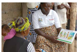
母親支援グループでは、保健センターの指導を受けた母親が講師を務めることで、知識がより広がることを目指しています。読み書きができない人も多いため、紙芝居や歌で学習します