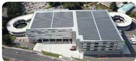
千葉県野田市にある 物流センターの屋上に 設置した太陽光発電パネル

また、産直産地で直売所などの施設に太陽光発電パネルを設置・送電しているところもあります。農産物だけでなく、産地で作られた電気も組合員の皆さんのもとへお届けしています。