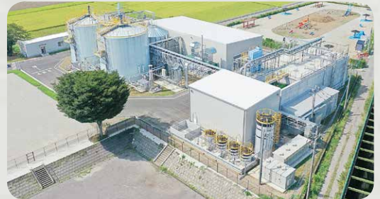
ニューエナジーふじみ野株式会社

食品廃棄物を「ニューエナジーふじみ野株式会社（埼玉県ふじみ野市）」のバイオガス発電所に運びます。食品廃棄物をタンクの中に入れ、微生物の力で発酵。するとメタンを主成分とするバイオガスが発生します。このバイオガスを燃やして発電します。