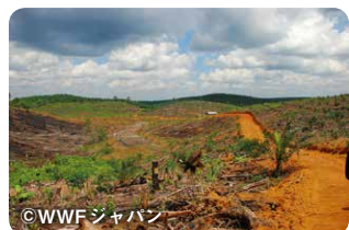
インドネシア・西カリマンタン州では、パーム油の原料となるアブラヤシ農園を作るために熱帯林が伐採されています

世界では、1990年以降、推定4億2千万ヘクタールもの森林が減少したとされています。これは、日本の約11倍の広さの森が失われたということです。その原因はさまざまですが、私たちのくらしもその一つ。日々利用する木材や紙、そして食品や洗剤などに使われる「パーム油(植物油)」などの生産が、時に世界の森林破壊の要因となっているからです。 森林は、私たちに資源をもたらすだけでなく、水の供給源であり、多くの生き物のすみかであり、地球温暖化につながる二酸化炭素(CO 2 )を吸収してくれる存在でもあります。豊かな森を未来につ