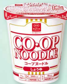
CO-OP コープヌードル しょうゆ

コープデリグループは、事業と活動を通して「SDGs (持続可能な開発目標)」の達成を目指しています。