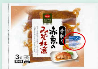
CO-OP 骨取り赤魚のみぞれ煮