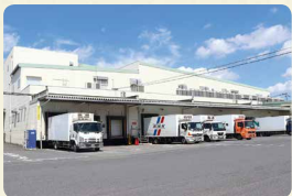
桶川要冷蔵品センター（埼玉県桶川市）。冷蔵商品などを集品・分荷し、宅配センターへ配送しています

コープデリ連合会では独自の商品検査センターを持ち、年間約3万件の検査を行っています