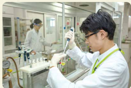
商品検査センターは、フードチェーン全体での食の安全の取り組みが機能していることを、科学的・客観的に確認しています