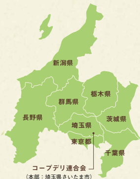
コープデリ連合会（本部：埼玉県さいたま市）