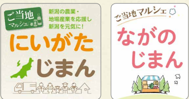
「ご当地マルシェ」ロゴ。各生協ごとに異なります

コープデリ連合会は、今後も会員生協の組合員の皆さまのくらしに貢献できるよう、事業と活動に取り組みます。1都7県のコープが手をとりあって、今までできなかったことも、共同の力で実現していきます。設立30周年にあわせて、今後キャンペーンを行う予定です。お楽しみに！