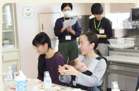
商品グループインタビュー。組合員の皆さまから、商品の改善に向けてさまざまな声を聞かせていただいています

コープデリ連合会で商品をもとめて仕入れることで、利用しやすい価格で取り扱うことや取り扱い商品数を増やすことができます。また、多くの組合員さんの声を集め、共有することで、商品の改善やサービスの向上につながることもできます。組合員さんの「こんな商品あったらいいな」の声を反映し、商品を開発しています。