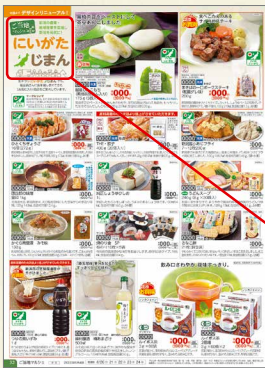
「ハビ・デリ！」誌面イメージ

共同で行う業務もある一方、各生協の歴史や地域特有の商品を大切にしています。宅配の商品カタログ「ハビ・デリ」の「ご当地マルシェ」のコーナーは、地元で製造していたり、地域になじみのある商品を各生協ごとに紹介しています。