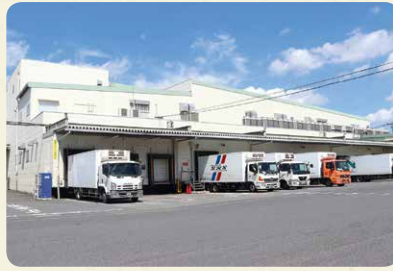
桶川要冷蔵集品センター（埼玉県桶川市）。 冷蔵商品などを集品・分荷し、宅配センターへ配送しています

す。以前は会員生協それぞれで商品を検査していましたが、コープデリ連合会でその役割をまとめて行うことで、 今までそろえられなかった検査機器をそろえたり、人材確保・育成ができるようになりました。 2018年にはリニューアルし、見学もできようになりました。