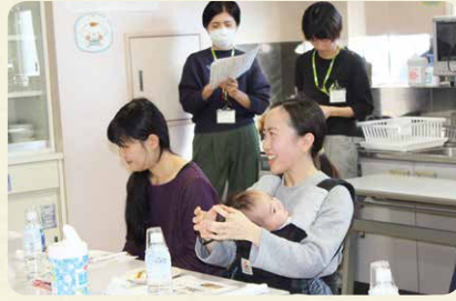
商品グループインタビュー。 組合員の皆さまから、商品の改善に向けてさまざまな声を聞かせていただいています

コープデリ連合会で商品をまとめて仕入れることで、 利用しやすい価格で取り扱うことや取り扱い商品数を増やすことができます。 また、 より多くの組合員さんの声を集め、共有することで、商品の改善やサービスの向上につながる ことができま す。組合員さんの「こんな商品あったらいいな」の声を反映し、商品を開発しています。