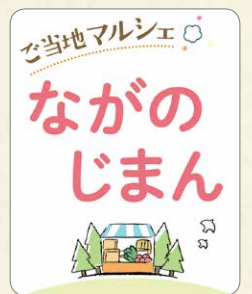
「ご当地マルシェ」ロゴ。各生協ごとに異なります

コープデリ連合会は、今後も会員生協の組合員の皆さまのくらしに貢献できるよう、事業と活動に取り組みます。1都7県のコープが手をとりあって、今までできなかったことも、共同の力で実現していきます。 設立30周年にあわせて、今後キャンペーンを行う予定です。お楽しみに！