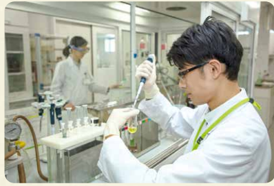
商品検査センターは、フードチェーン全体での食の安全の取り組みが機能していることを、科学的・客観的に確認しています

物流センターを各地域に配置し、 効率良く集品・分荷し、宅配センターや店舗への商品配送を行っています。 コープデリ連合会では独自の商品検査センターを持ち、年間約3万件の検査を行っています