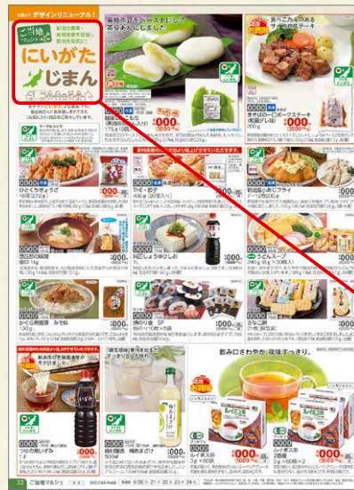
「ハピ・デリ！」誌面イメージ

共同で行う業務もある一方、各生協の歴史や地域特有の商品を大切にしています。宅配の商品カタログ『ハピ・デリ！』の「ご当地マルシェ」のコーナーは、地元で製造していたり、地域になじみのある商品を各生協ごとに紹介しています。