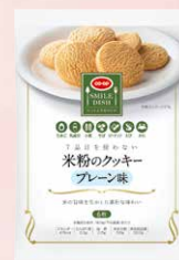
CO-OP 7品目を使わない 米粉のクッキー プレーン味 1個

※「ワン・モア・ライス」やってみた宣言」や「ワン・モア・ライス」アイデア」は何回でも投稿していただけますが、プレゼントの応募は期間中1人1口とさせていただきます。なお、プレゼント企画の対象は組合員とさせていただきます ※賞品の発送は11月中旬を予定しています。厳正な抽選により当選者を決定し、賞品の発送をもって発表にかえさせていただきます。 なお、抽選方法や当選についてのお問い合わせは受け付けておりません