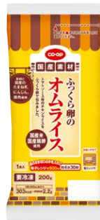
co-op ふっくら卵のオムライス

ふっくら焼き上げた卵シートでチキンライスを包みました。チキンライスは国産のたまねぎ、鶏肉、にんじんの具材入りです。