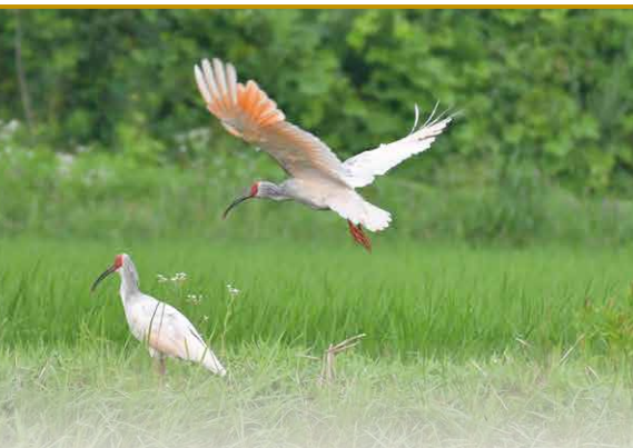
田んぼの中を舞い、エサのドジョウやカエルをついばむトキ。 2023年時点で野生下のトキは500羽を超えた