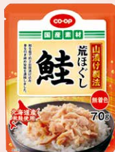
CO-OP 山漬け製法 荒ぼぐし鮭 1個