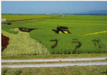
2023年の田んぼアート。 今年のテーマは東京都在住の小学生が考案した「わたしたちと田んぼのつながり」