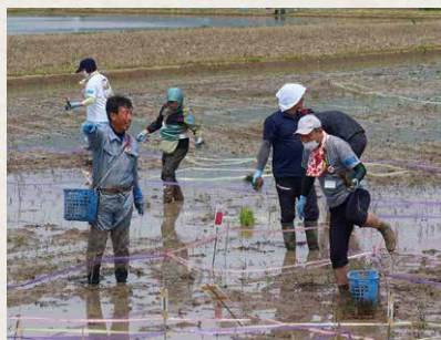
今年5月に行われた田植え交流の様子。 組合員やその子どもと一緒に、 さまざまな品種の稲を植える「田んぼアート」や 生きもの調査を行った

一番の成果はトキが増えたことで す。それは生きものが田んぼに生息 しているからこそ。農薬を減らした ため、カメムシなど米の害虫は当然 います。トキの放鳥前、農家はお米 と害虫しか見ていませんでした。で も今の佐渡の農家は、害虫も当然見 ますが、それを食べているクモなど の益虫、トンボやカエルも含めた生 きものがあるかを確認します。農薬 を減らしても、昔に比べて害虫の被 害は減っています。生態系のバラ ンスが保たれ、益虫が害虫を食べるか ら、その分農薬を減らせるのです。 佐渡にはいろいろな生きものが多い。 田んぼはお米だけではなく、生 きものも、そして風景も育てている、 という感覚があります。