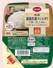
CO-OP 産直 新潟佐渡 コシヒカリで作ったごはん 1個