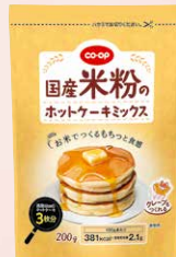
CO-OP 国産米粉の ホットケーキミックス 1個