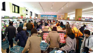
出店・改装を実施し、来店された方が気持ち良くお買い物ができる環境をつくります(写真は2月にオープンしたコープ杉並井草店)

●組合員活動では多様な考えを尊重したコミュニケーションを大切に、新たな参加が広がる取り組みを進めます。