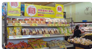
宅配・店舗で「コープのくらし応援全国キャンペーン」などのセールを実施し、ご利用の多い商品を特別価格で提供しました

事業と組合員活動が連携し、「コープみらいの総合力」を發揮するとともに、多彩な参加の場で持続可能な社会づくりと社会への発信を進めました。