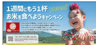
「1週間にもう1杯お米を食べようキャンペーン〜フン・モア・ライス〜」など、国内の生産者を応援する取り組みを進めました