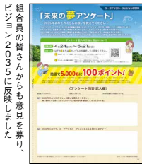
組合員の皆さんからも意見を募り、ビジョン2035に反映しました

ビジョンは、コープデリグループの理念「CO・OP」ともにはぐくむくらしと未来」に基づいて、10年後のありたい姿を具体的に表したものです。コープデリグループではビジョンを10年ごとに策定しており、「ビジョン2035」の検討は2022年度からスタート。組合員の皆さんに広くお知らせするとともに、ブロック別総代会で報告と話し合いを行い、職員からも意見を募りました。