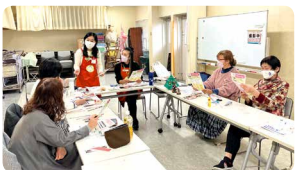
「みらいひろば」など地域に開かれた居心地の良い場所づくりや新たな参加が広がる取り組みを進めます