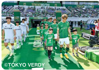
エスコートキッズはあこがれの選手を間近で感じられる機会となりました

4月28日(日)味の素スタジアムにて、コープみらいが協賛するJ1東京ヴェルディホームゲームの特別ピッチ企画を実施。組合員とのお子様などを招待して、試合前アップ見学会やアビスパ福岡戦のエスコートキッズなどを行いました。また東京ヴェルディと協力してフードドライブ・スタディドライブ企画も開催し、来場者から多くの食品・文具を寄贈していただきました。寄贈された食品・文具は、NPO法人フードバンクTAMAを通じて必要としている方にお届けしました。