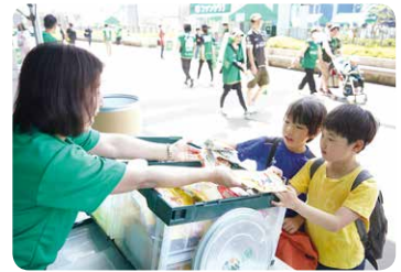
来場者に食品66kgと文具768点をお寄せいただきました