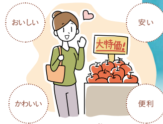
日常のお買い物に「新しい視点」をプラス！

安く、便利な商品をもっとたくさん使いたい……。でもその商品を作るために、魚の乱獲や森林の伐採、開発途上国での劣悪な労働環境など、さまざまな問題が引き起こされている場合があります。商品が私たちに届くまでには長い道のりがあり、手にした商品がどのように作られたのか、私たちに分かりにくいことが多いからです。だからこそ、毎日のお買い物でできることがあります。いつもの「商品の選び方」に、「どこで、誰が作っているか」「どのようにつくられたか」といった視点をプラスして