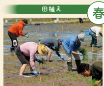
田んぼに異なる品種の苗を植えて絵を描く「田んぼアート」の田植えを行いました

プロジェクトでは、地元生協のコープデリにいがたを中心に組合員・職員が毎年佐渡を訪問。JA佐渡の生産者や地元の皆さんと交流し、見て・聞いて・体験することで、より多くの方にプロジェクトへの理解が広がることを目指しています。