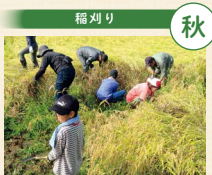
鎌を初めて手に取る組合員の皆さんも、生産者さんからコツを教わってもらい、サクサクと刈っていました

コープデリグループは、事業と活動を通して「SDGs(持続可能な開発目標)」の達成を目指しています。