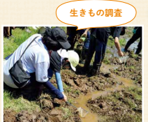
田んぼやビオトープにすむ生きものを調べ、生きもの多様性やトキと暮らす環境づくりを学びました