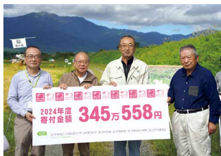
10月、田んぼアートの前で寄付金贈呈式を開催。組合員から生産者への応援メッセージもお渡ししました

2024年度寄付額 345万558円 累計寄付額 (15年間) 3,972万2,653円