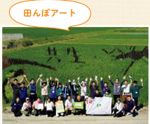
今年の田んぼアートのテーマは「共生」。順調に稲穂が実り、きれいな絵がくっきりと浮かび上がりました