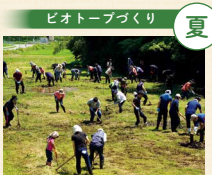
田んぼの周辺を耕し、トキのエサ場となるビオトープを作りました