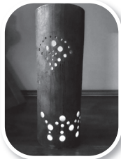
当日参加者の作品