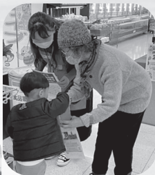
ボランティアの組合員さんと一緒に呼びかけました。