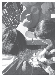
ぶつもし 佛母寺(銭洗い弁財天)

3月27日(水) 参加者15人(うち子ども2人) 若泉公園の桜がまだつぼみだったため、本庄市長おすすめの本庄七福神めぐりを中心に歩きました。明治・大正期には養蚕業で栄えた面影を残す建造物、文化財も多く残っており、それらを見ながら回りました。「旧本庄商業銀行煉瓦倉庫」は繭や生糸を保管していたれんが造りの建物で、ガイドの方が丁寧に案内してくれました。参加者からは「1人ではなかなか歩けないが、みんなと気軽に歩いて良かった」「地元ながら来る機会がなかったので、参加できて良かった」などの声が寄せられました。