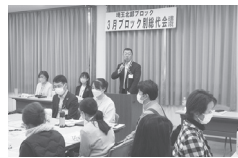
ブロック別総代会議の様子

総代にご興味のある方は、コーププラザ深谷までお問い合わせください♪ スライドなどで分かりやすく報告します。