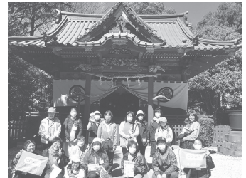
かなさなじんしゃ 金鑽神社(恵比寿尊)