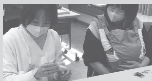
みらいひろばプラザ深谷の様子

くらしのこと、コープのこと、 地域のこと、和気あいあいと 楽しくおしゃべりしています。 お気軽にご参加ください♪