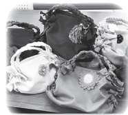
< 作品例 >

3月のみらいひろば日進では、切って結んで作るフェルトバッグを作りました。手を動かしながら楽しくおしゃべり♪最後の仕上げにお手持ちのコサージュや飾りボタンをつけて記念撮影です。個性豊かにすてきなバッグが完成しました。