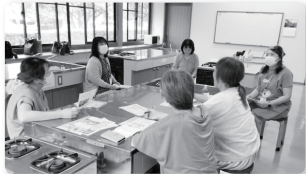
▲みらいひろば羽生・大利根