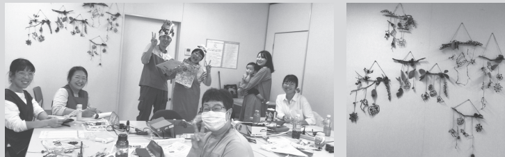
10月のみらいひろば本庄の様子・ハロウィン工作をしました♪