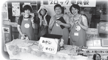
▲ミニコープお茶山店 応援企画