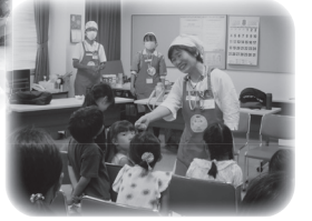
▼夏休み親子で遊ぼう 「パステルあーと」と 「フルーツポンチ作り」