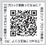
▲ブロック委員を動画で紹介!