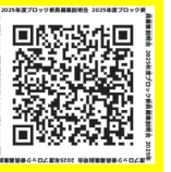
▲コープみらいのホームページや携帯電話からもお申し込みできます

お申し込み・お問い合わせ 埼玉西北ブロック事務局 TEL 049-226-1393 10時~16時(日祝・12/29~1/5休)