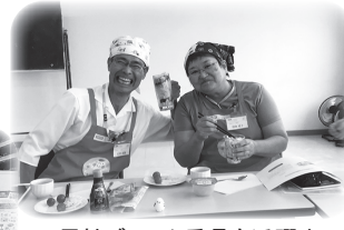
▲男性ブロック委員も活躍中!