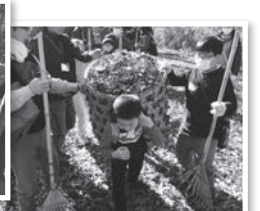
*昨年の落ち葉はきの様子

紙面に関する「お問い合わせ・お申し込み」はコーププラザ所沢/埼玉西南ブロック事務局まで