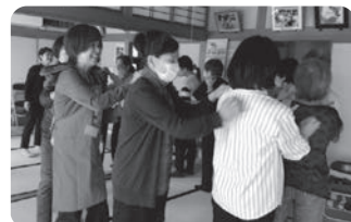
地域の皆さんと交流