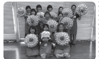
楽しく活動しています!