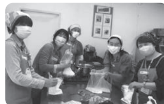
時にはみんなでクッキング