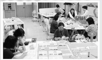
▲コープみらいフェスタ 準備作業