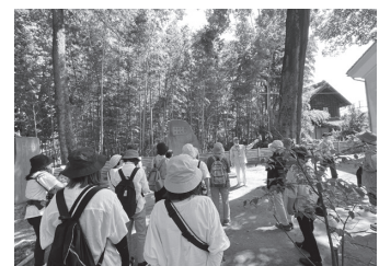
ガイドの話に耳を傾ける