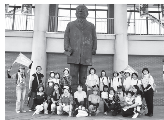
渋沢栄一記念館 渋沢栄一像と一緒に

スタートの「渋沢栄一記念館」と、ゴールの栄一翁の生家「旧渋沢邸 中の家(なかんち)」には見学コースがあって楽しく歴史を学ぶことができました。「近いが来たことがなかったのが良い機会だった」「歩くことでわかることがあって良かった」との嬉しい感想がありました。これからも参加者とブロック委員が気軽に交流しながら地域の名所を楽しめる「ほくほくさんぽ」を続けていくので、楽しみにしててください♪