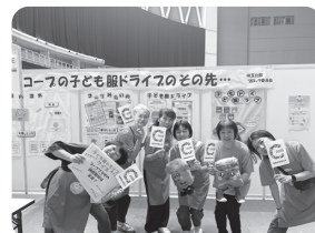
楽しく活動しています