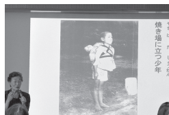
ー 被爆の証言 ー

大学生3人、高校生2人、中学生1人を含む10人の組合員とともに参加し、80年前のできごとや被爆者の想いを学びました。今年はさらに若い世代の参加が増え、戦争体験を継承する貴重な場となりました。