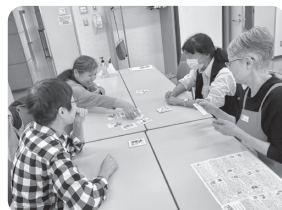
地域の皆さんと交流