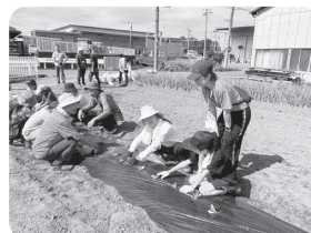
時にはみんなで収穫体験