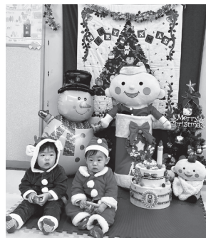
12月のひろばの様子