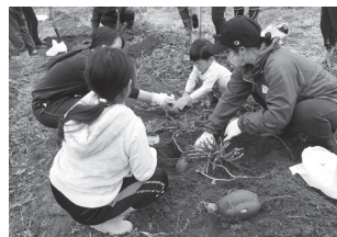
「大きいサツマイモ!!」

11月1日(土) 会場:美里町社会福祉法人美里会「みさとの森」 参加者:65人(うち子ども16人) 美里会の方が大切に育ててくださった今回の収穫物は、サツマイモ、ネギ、キウイフルーツの3品♡昨年はイノシシ被害にあったサツマイモでしたが、今年は電気柵に守られ夏の暑さも乗り切り、大きく実り豊作でした♪「宝探しみたいで楽しい!」と子どもたち!土深く植えられたネギや、棚からぶら下がる大きなキウイフルーツの収穫を、参加者みんなで楽しみました。「子どもたちが楽しく参加でき、親もうれしくなった」「普段の生活ではなかなかできない体験ができました」などたくさんの感想が寄せられました。