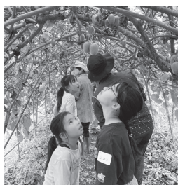
「キウイフルーツってこうやって実るんだね」