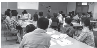
「美里町の魅力紹介」