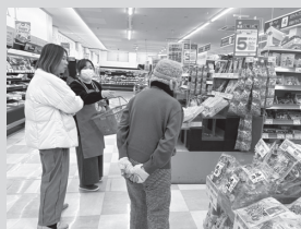
みらいひろば熊谷

コープの取り組み・地域の情報交換など楽しく おしゃべりできる場です。簡単工作や簡単調理 などもやっています。子育て中の方、シニアの 方どなたでも大歓迎です!