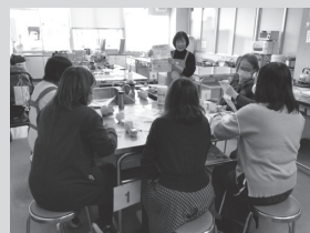
みらいひろば寄居