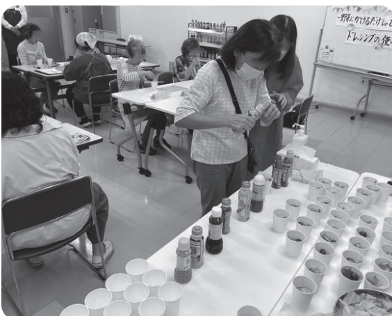
色々なドレッシングが試せてうれしい!