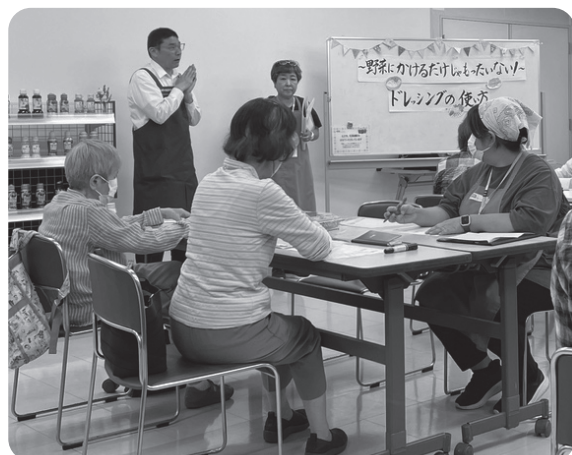
副店長から商品説明をいただきました。