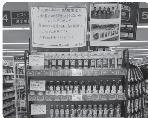
お店の期間限定特設コーナーに、試食したドレッシングがずらりと並びました。