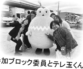
参加ブロック委員とテレ玉くん