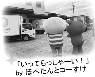
「いってらっしゃーい!」 by ほぺたんとコーすけ