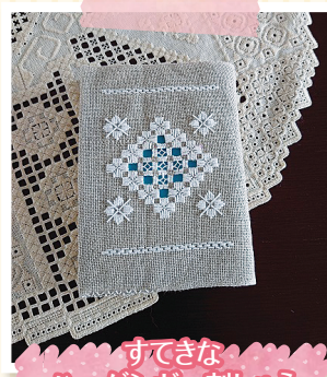
すてきなハーダンガー刺しゅう