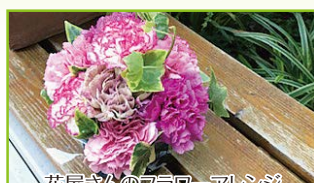
花屋さんのフラワーアレンジ ~カーネーションのアレンジメント~