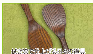
拭き漆で仕上げる日々の道具 ~杓文字~