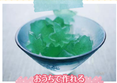
おうちで作れる季節の和菓子