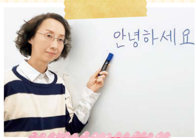
はじめての韓国語