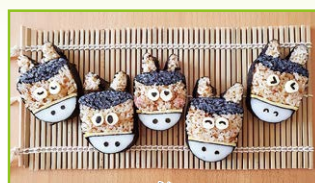
絵巻き寿司~午と四海巻き~